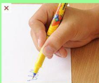
křečovitě držení pera