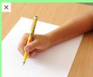
špetkový úchop s palcem