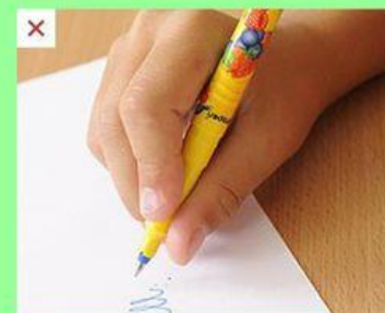
nízký křečovitý úchop