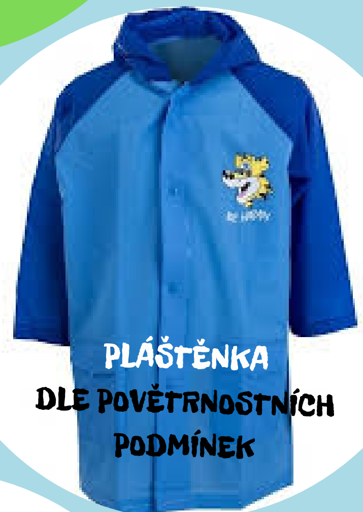
PLÁŠTĚNKA DLE POVĚTRNOSTNÍCH PODMÍNEK