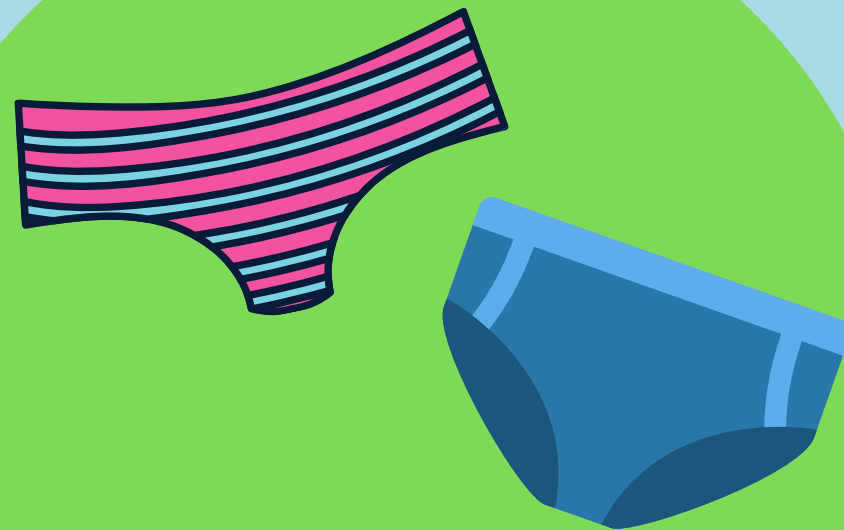
NÁHRADNÍ SPODNÍ PRÁDLO DLE INDIVIDUÁLNÍ POTŘEBY DÍTĚTE