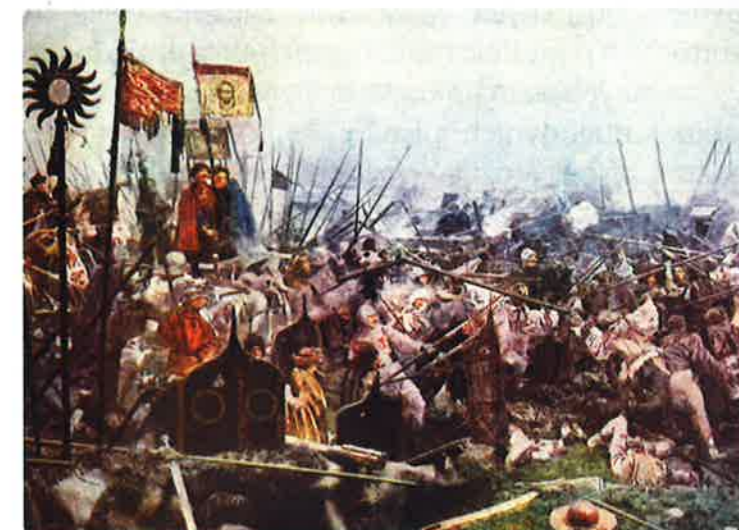
Výjev z panoramatického obrazu Bitva u Lipan (Autorem je český malíř 19. století Luděk Marold.)