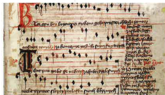
Píseň Ktož jsú boží bojovníci v Jistebnickém kancionálu

Bojové vozy husité srazili k sobě, kola svázali řetězy a vytvořili tak vozovou hradbu, která sloužila jako opevnění. Vozovou hradbu využili např. ve vítězné bitvě u Sudoměře v roce 1420.