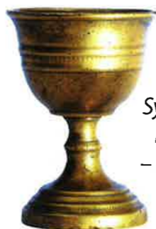
Symbol husitů – kalich

Kalich byla nádoba, která se používala při bohoslužbách. Víno (symbolizující Kristovu krev) z něj směli pít jen představitelé církve. Husité vyžadovali přijímání vína z kalicha pro všechny věřící. Kalich se proto stal symbolem rovnosti všech lidí . Husitům se také říkalo kališníci .