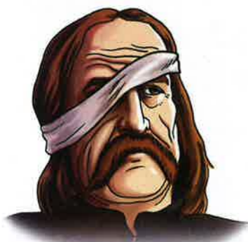
Jan Žižka z Trocnova