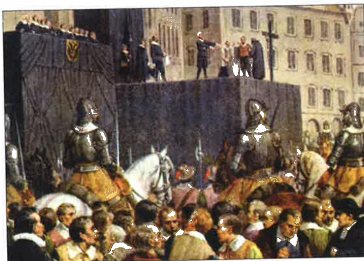
poprava na Staroměstském náměstí roku 1621 (Josef Mathauer)

Do vyhledávače zadejte „Staroměstské náměstí“, z nabídky zvolte „Poprava 27 českých pánů“. Zjistíte, co je napsáno na pamětní desce popravených pánů.