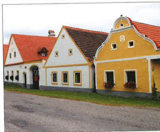
domy ve stylu selského baroka (Hološovice)