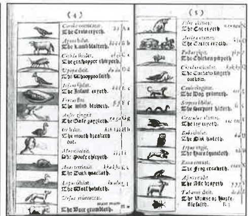
stránky z Komenského učebnice Svět v obrazech

PT Zamyslete se, jaká opatření by museli lidé udělat, aby se Komenského myšlenky o skončení válek a násilí splnily.