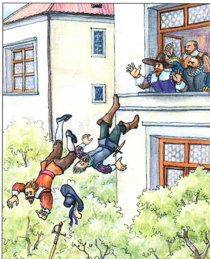
vyhození královských úředníků z oken Pražského hradu v roce 1618 (tzv. defenestrace*)

Z Skupina šlechticů se tehdy vydala za královskými úředníky na Pražský hrad. Vytýkali jim, že porušují výhody šlechty a měst. Došlo k hádce a rozhněvaní šlechtici vyhodili dva úředníky a písaře z oken do hradního příkopu. Ti dopadli na hromadu odpadků, takže se jim celkem nic nestalo. To byl začátek povstání proti Habsburkům.