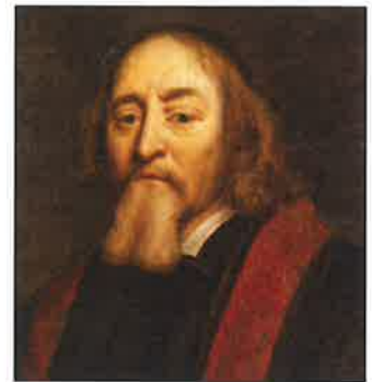
Jan Amos Komenský

Z V této době se děti musely všechno učit nazpaměť a při zkoušení odříkávat učivo přesně tak, jak bylo v učebnici. Komenský chtěl, aby se děti učily snadno a hodiny byly zábavné – taková „škola hrou“. Probíranou látku vysvětloval tak, aby ji děti pochopily. Používal obrázky, modely a jiné názorné pomůcky. Komenský také navrhoval, aby do školy chodili nejen chlapi, ale také děvčata.