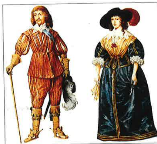
barokní oděv vyšších vrstev

Čištější z dobře vychově patřilo v této době umění hrát alespoň na jeden hudební nástroj. V bohatých rodinách byly v módě domácí koncerty.