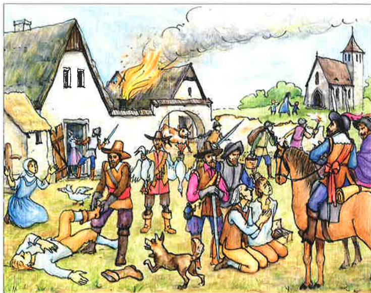
násilnosti po bitvě na Bílé hoře