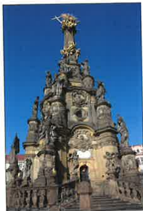
barokní morový sloup (Sloup Nejsvětější Trojice, Olomouc)