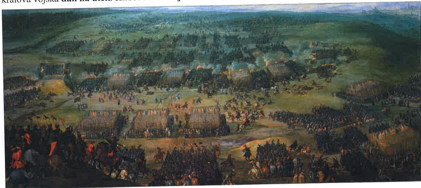
bitva na Bílé hoře (dobové vyobrazení)

Rozpory mezi Habsburky a českou šlechtou vedly nakonec k bitvě. Armáda krále z rodu Habsburků Ferdinanda II. se střetla s vojskem českých šlechticů 8. listopadu roku 1620 na Bílé hoře u Prahy. Bitva trvala necelé dvě hodiny. Špatně vyzbrojení a málo placení vojáci české šlechty se hned po prvním útoku králova vojska dali na útěk. Habsburské vojsko tak zvítězilo a mohlo bez dalšího boje vstoupit do Prahy.