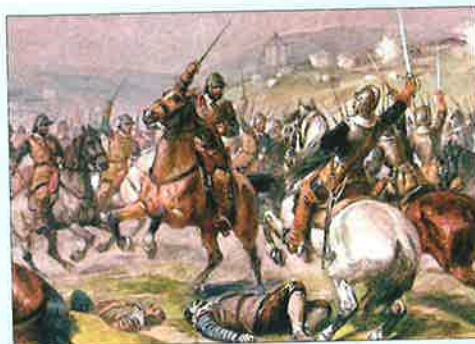
(Miloš Kratochvíl: Památné bitvy našich dějin)

Jak popisují bitvu na Bílé hoře velitelé královského vojska: „Ne – nemohli jsme věřit svým očím. Část po části pěchoty české šlechty se obracela, zahazovala zbraně, prchala! Totéž se opakovalo při útoku jízdy... Na bělohorské pláni vládl zmatek. Nikdo asi neměl přehled o bitvě. Viděli jsme, jak jsou české pluky posílány různými směry. Naše královské pluky nastoupily na bělohorskou planinu. Oddíly české šlechty opouštěly úprkem bojiště směrem k městu. Jen tu a tam se nám něco postavilo do cesty. Ale to již nemohlo změnit jejich porážku.“