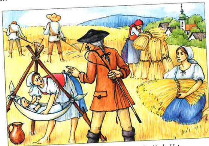
robota na panském (v popředí dráb)

Nejpočetnější skupinou obyvatel ve městech byli řemeslníci a obchodníci . Za hradbami měst měli svá hospodářství – pole a dobytek. Ve městech dále žili např. lékaři, písaři, učitelé, studenti, služky a městská chudina (žebráci, tuláci, zloději apod.) .