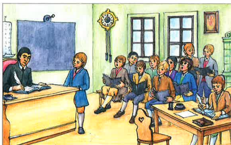
školní třída na začátku novověku

Slabikář Český/ a jiných náboženství počát- kové: kterýmžto věcem dítky Křesťanské hned zmladosti učeny býti mají.