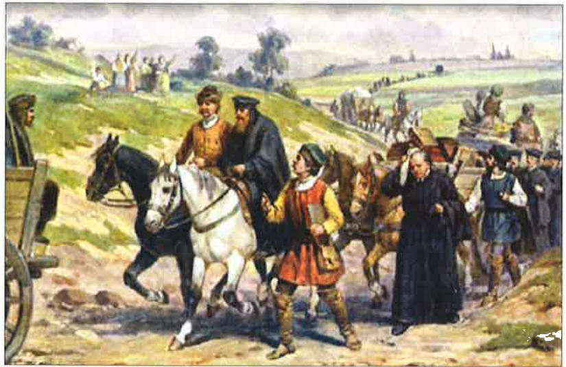
nekatolíci opouštějící českou zemi (Josef Mathauser)

Všechny obyvatele českých zemí se na katolické náboženství převést nepodařilo. Někteří tajně dál vyznávali svoji víru.