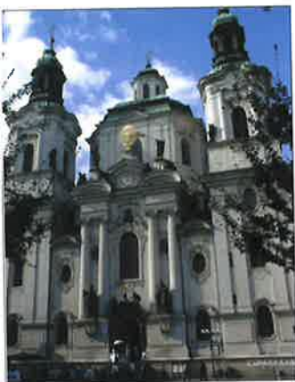
barokní kostel kostel sv. Mikuláše, Praha)

Udělejte si ve třídě výstavku pohlednic a fotografií českých a moravských zámků postavených v renesančním a barokním slohu. Porovnejte jejich vzhled.