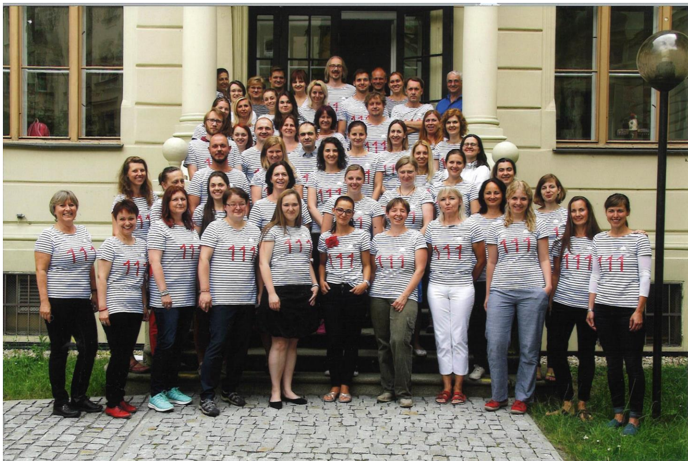
ZŠ Lyčkovo náměstí - školní rok 2017-18

Děkuji všem pedagogům a zaměstnancům školy za realizaci 111. roku této školy. Jste prostě jedničky!